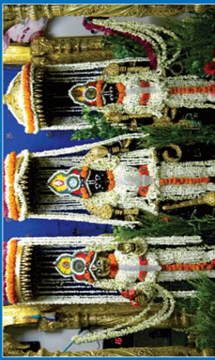
શ્રીહરિ અંતર્ધાન લીલાના દિવસે મહાઆરતીનો લાલ લેતા સંતો-ભક્તો-ભુજ.